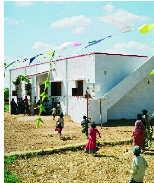
Inauguration Sirkali, mars 2007: trois bâtiments qui changeront la vie des familles.

La construction d'un troisième centre communautaire débute par ailleurs en ce moment dans le village de Thirumvaisal, à Sirkali également, avec la collaboration d'ADER. La fin des travaux est prévue pour le début de l'automne 2007.