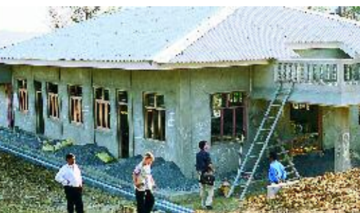
Port-Blair 2007: le 1er de plusieurs bâtiments pour améliorer l'éducation.

Les représentants de l'ASED suisse et indienne ont vérifié la bonne exécution de la construction du centre résidentiel et de formation destiné aux enseignants exerçant sur les centaines d'îles de l'archipel indien dont certaines restent dans un état de sous-développement grave. L'achèvement des travaux est prévu cet été et l'inauguration en automne. Cette réalisation de grande envergure, dont il est convenu que le fonctionnement sera garanti par le Département de l'Education, assurera une amélioration de formation du corps enseignant ayant pour but ultime d'offrir de meilleures chances aux enfants indiens de cette région proche d'Aceh très affectée par le tsunami. Par ailleurs, le programme de formation en soutien psychosocial, soutenu par l'ASED dans le cadre de ce projet, a débuté en janvier et se poursuivra ces prochains mois.