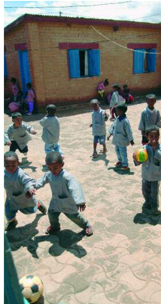
Madagascar, "A Bonne Ecole" 2007: nourris et instruits, ils grandissent.