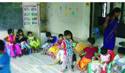
Karaïkal, mars 2007: presque nés avec le tsunami, ils ont leur école.

L'ASED a soutenu le démarrage de l'école enfantine « Little Angels » dans la ville de Karaïkal, en collaboration avec une équipe d'enseignants diplômés. Prévue pour 20 enfants à ces débuts, cette petite école fonctionne avec de très petits moyens et accueille aujourd'hui 40 enfants de 3 à 5 ans. La raison de cet engouement provient de la qualité de l'enseignement basé sur une méthode qui stimule l'enfant à se construire et à développer son autonomie. Cet enseignement est approprié pour des enfants en détresse et de milieu défavorisé ou ayant subi des traumatismes. Après déjà une demi-année, nous avons pu constater l'effet positif d'une telle prise en charge sur ces enfants.