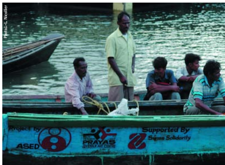
île de Baratang: bateau offert par ASED aux villageois