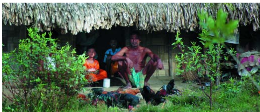
Cadre bucolique mais néanmoins très défavorisé de Baratang nécessitant un large soutien éducatif