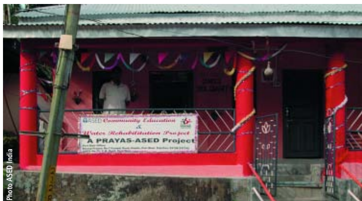
Centre ASED de Nilampur

Remerciement et reconnaissance du Département de l'éducation d'Andaman