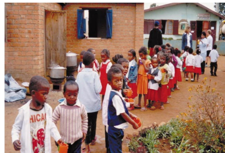
Avant le goûter, on se lave les mains!