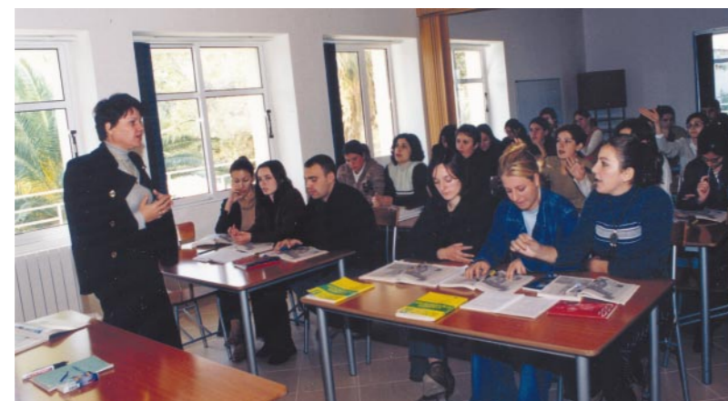
Les premiers étudiants de l'INALPES