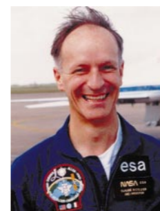
Claude Nicollier, Astronaut Ehrenpräsident ASED

Claude Nicollier, warum haben Sie das Amt als Ehrenpräsident der ASED angenommen? Heute werden die Ergebnisse der Forschung noch nicht in genügendem Umfang dafür genutzt, die Lebensqualität in den ärmsten Ländern zu verbessern. Daher wollte ich ein Zeichen setzen, indem ich eine dynamische und seriöse Organisation im humanitären Bereich unterstützen wollte, die sich mit konkreten Kooperationsprojekten für die ärmsten Kinder dieser Welt einsetzt. Es wäre falsch zu glauben, als Astronaut betrachte ich die Welt nur von oben. Jedes Mal, wenn ich zu ihr zurückkehre, schätze ich sie und ihre Bewohner noch mehr als zuvor.