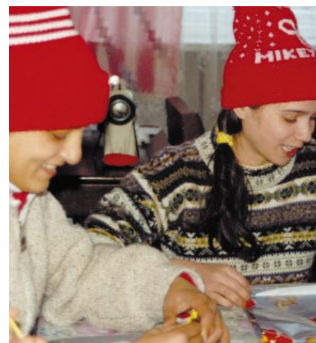
Adolescents à former

Notre association a déjà acquis le terrain sur lequel le bâtiment abritant les ateliers sera construit. Sur la base d'un avant-projet dessiné par un architecte suisse travaillant bénévolement, les plans ont été établis par un bureau d'architectes roumain et un concours est lancé pour désigner l'entreprise roumaine qui sera chargée de la construction.