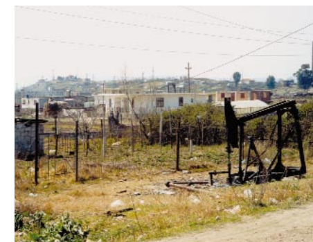
Les "voisins" de l'école...

en friche. Actuellement, beaucoup d'entre eux fréquentent d'autres écoles enfantines, mais pas au quartier ouest qui en est dépourvu, et c'est à la demande de ses habitants que le Maire de Kucova a entrepris de trouver de l'aide pour redonner à ces petits, pendant la journée, un lieu d'accueil décent où ils puissent non seulement jouer, mais aussi, grâce à un personnel formé, commencer leur éducation scolaire. Convaincue de l'urgence qu'il y a à remédier à la situation actuelle, l'ASED a accepté de mettre sur pied, en collaboration avec la Mairie de Kucova, le projet de construction de la petite école, qui remplacera la ruine actuelle sur le même emplacement. Le projet mûrit depuis 2001. Il devra permettre de trouver les moyens de réaliser dès que possible (printemps 2004) ce nouveau jardin d'enfants tant attendu.