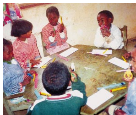
École enfantine à Tananarive, Madagascar

Le premier but de cette école, reconnue par le Ministère de l'Éducation, est d'empêcher les enfants de traîner dans les rues et de faire des petits boulots. Mais il s'agit surtout d'éveiller en eux le goût d'apprendre. La scolarisation peut-être une chance pour eux de s'en sortir.