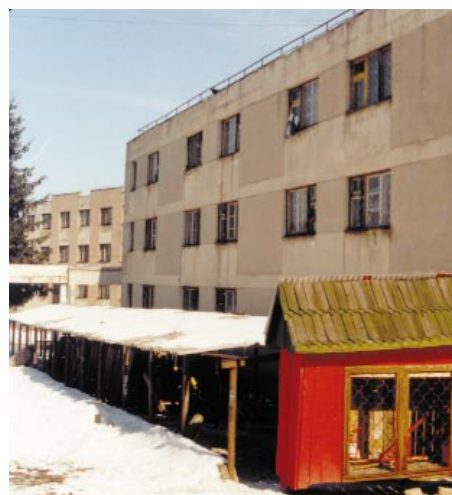
Centre d'assistance de Hirlau

C'est un drame pour la Roumanie. En raison de son manque de moyens, l'Etat, même aidé par un certain nombre d'ONG étrangères, n'a pu jusqu'à présent qu'améliorer de façon limitée les conditions de vie des personnes en institution. Il faut établir de véritables programmes d'insertion socio-professionnelle.