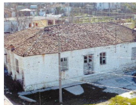
L'actuel bâtiment à reconstruire

La ville se redresse, très lentement, et l'ASED veut soutenir ses efforts. Les enfants de ce quartier périphérique, surtout les petits, n'ont pas d'autre terrain de jeu que la rue. Leur jardin d'enfants ne peut plus les accueillir, le bâtiment tombe en ruine, les moyens pour l'entretenir ont manqué et les alentours sont